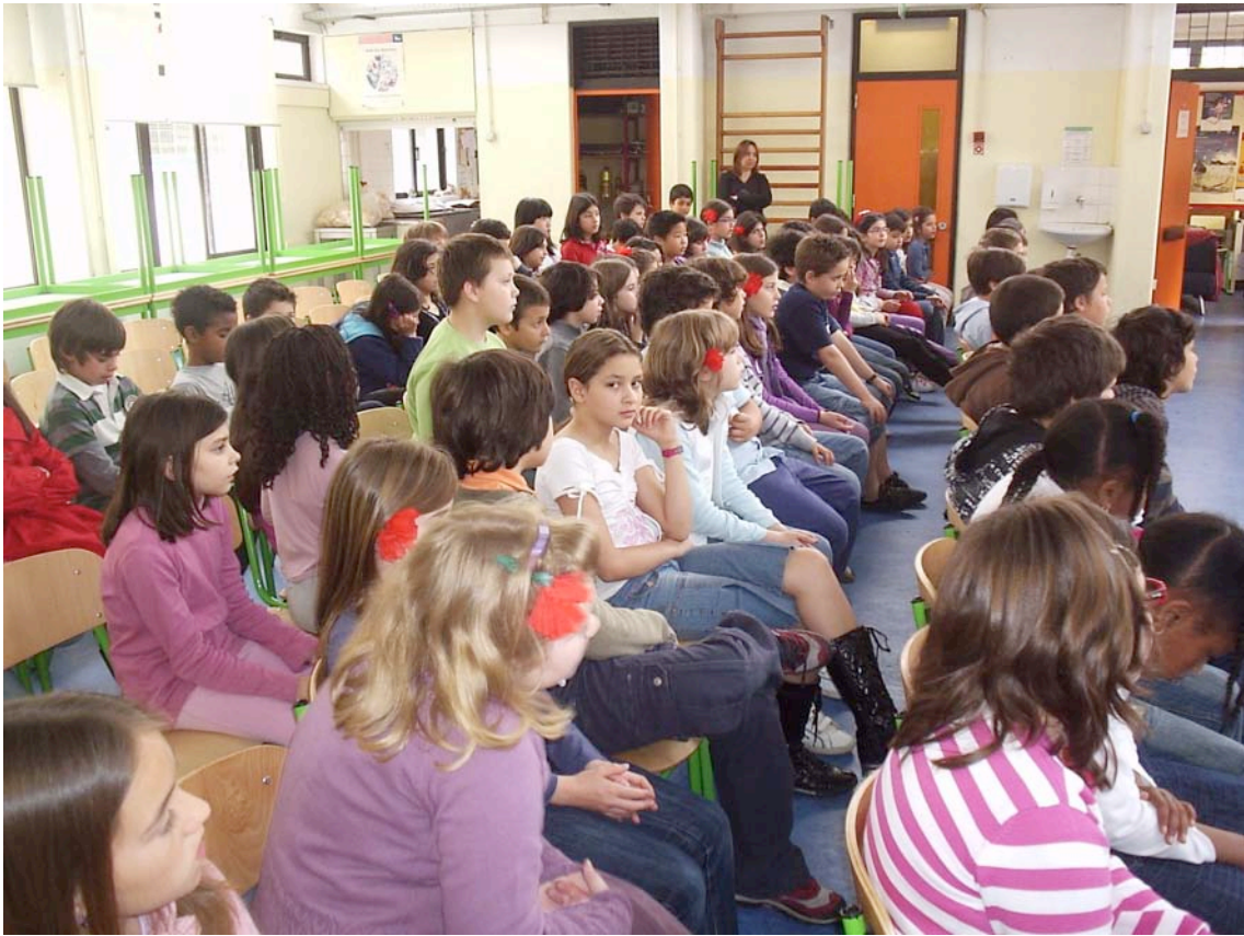
Uma sala cheia...