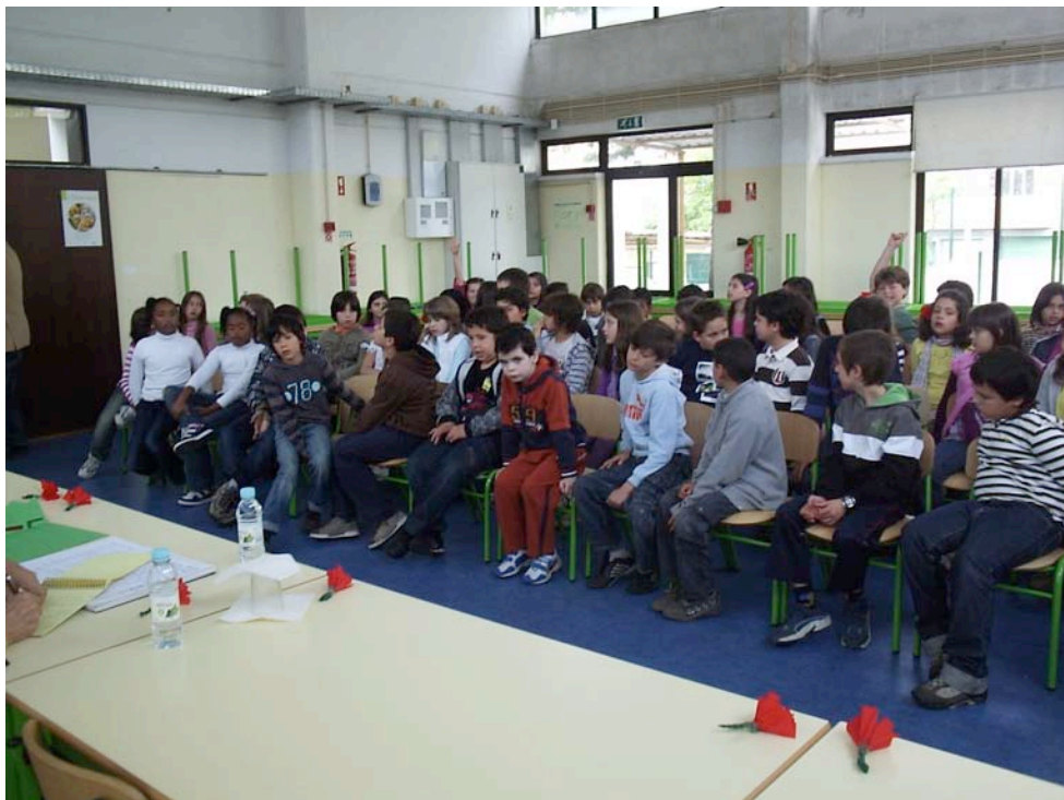
Os alunos fizeram muitas perguntas.